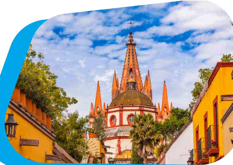
SAN MIGUEL DE ALLENDE