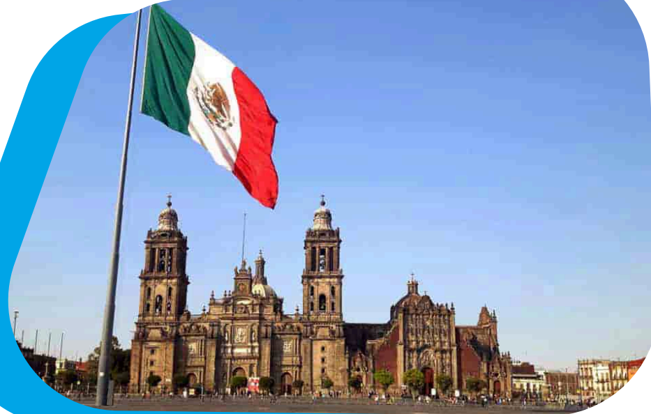
CIUDAD DE MÉXICO